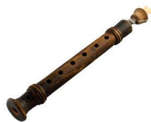
2. ábra Chirimina

görögből fordított szövegekben gyakran fuvola néven szerepel, és 18. századi európai említései még a fuvolafélékhez sorolják, de valójában a nádnyelves hangszerek családjába tartozik. Hengeres furatú, hangképző nyílásokkal ellátott teste legtöbbször nádból, fából vagy csontból készült. A hangszert a számos ábrázolás tanúsága szerint szinte mindig párosával szólaltatták meg. A zenei utalásokban gazdag görög