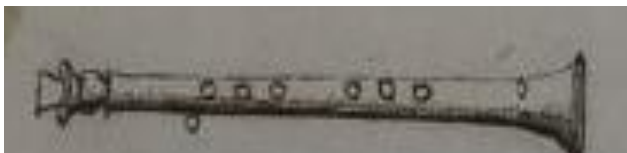
7. ábra Pifari Virgiliano "Il Dolcimeno" c. művében

A francia korabarokk oboa-együttesek (a Les Grand Hautbois vagy a Douze Grands Hautbois du Roi ) és angol földön népszerű oboákból vagy/és egyéb fúvós