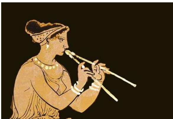
3. ábra Aulosz

Az aulosz (3. ábra) ókori görög fúvós hangszer. A