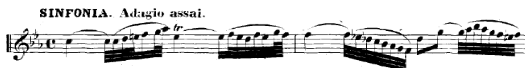
20a kottapélda Részlet a 12. kantáta Sinfonia tételéből – 1. ütem

A partitúra legfelső, oboa-szólama a legsűrűbb, ezt követik felülről lefelé a két hegedű mindig újra megszakított tizenhatod-menetei, a két brácsa általában párosával, a korábban már említett, ún. vonóvibratóval összekötött nyolcadhangjai, majd a basszus negyedszünetekkel váltakozó negyed-értékei. A tétel Adagio assai jelölése mindenképpen rendkívül lassú tempót szuggerál, ennek helyes megválasztását, legalacsonyabb értékét pedig talán az oboaszólam még éppen természetes játszhatósága (levegővétel, hangképzés!) segíthet eldönteni. Nem kell tehát túl nagy képzelőerő ahhoz, hogy elfogadjuk Dürr magyarázatát, és az oboaszólamot a sírással azonosítsuk (20a kottapélda),