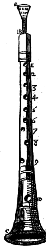
9. ábra Schalmei (?) ábrázolása náddal együtt Mersenne „Harmonie Universelle” c. művében

Mint fentiekből is kitűnik, legfeljebb tendenciákat lehet megállapítani a korabeli nádak dimenzióira vonatkozóan. Ki lehet jelteni, hogy ezek alapvetően inkább szélesebbek és végük felé jobban szélesedők voltak, mint a mai oboanádak.