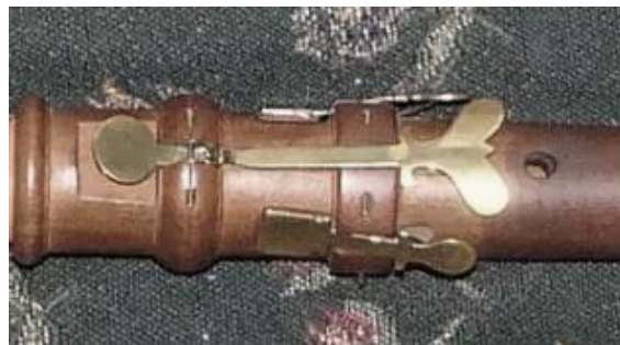
8. ábra Barokk oboa lábrésze két disz/esz' és egy c' billentyűvel

- egy nyitott állapotú C-billentyűje volt (tehát a hanglyukat alaphelyzetben nem fedte be) „fecskefark” kialakítással, hogy mind bal- mind jobbkezesek tudják használni