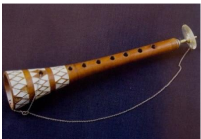
1. ábra Zurna

Az iszlamizált népeknél, a Közel-Keleten, a Balkánon,