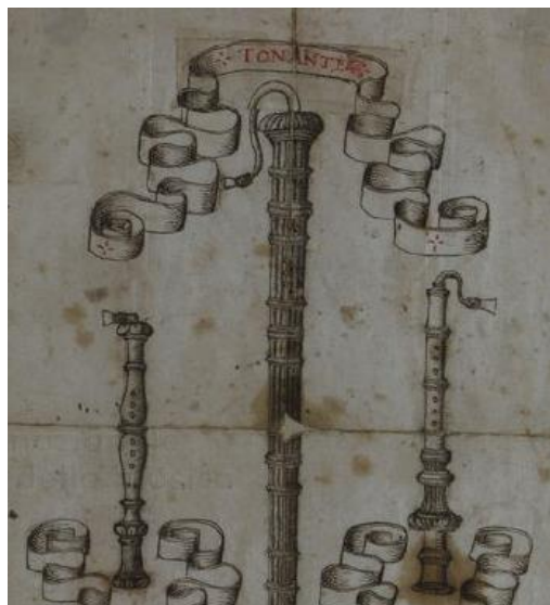
6. ábra Tonante , armilla és alta mira Virgiliano "Il Dolcimeno" c. művében

előtt, az előadásra szánt hangszer megnevezése után ott áll, hogy „minden más hangszeren” vagy „hasonló hangszereken” 5 is lehet játszani. A munka ezt követő részében a korban használatos hangszerek ábrázolását, nevüket és fogásaikat adja meg a szerző, itt az egyik oldalon tonante , armilla és alta mira néven három olyan hangszerábrázolást látunk (6. ábra), amely hangszerek inkább a későbbi oboára vagy a dulciánra hasonlítanak, mint a schalmei-család bármely tagjára. Bár ismert egy cromorne néven említett, ezekhez hasonló hangszer, amelyet elsősorban az 1600-as évek második felének francia udvarában használtak – nem összekeverendő az angolul crumhorn nak, németül Krummhorn nak, magyarul görbekürtnek hívott