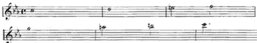
22. kottapélda Részlet a 12. kantáta recitativójából

kifejezvé a húsvéti bánat-öröm ellentétet. Utóbbi szövege az Isten országába való bemenetelt ábrázolja. 82