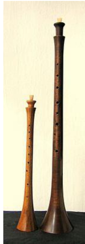
4. ábra Schalmei

Az ókori és középkori hangszerek pontos meghatározása, terminológiája és hangjuk, játékmódjuk